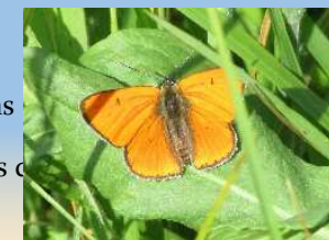
Cuivré des marais