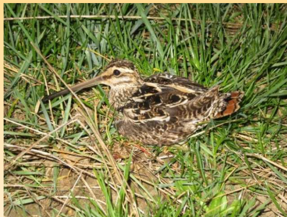
Bécassine des marais

Les premiers résultats étant encourageants, mais insuffisants, un vaste projet de réhabilitation a vu le jour à partir de 2011. Après études, inventaires et obtention des autorisations administratives, les travaux ont débuté en septembre 2016.